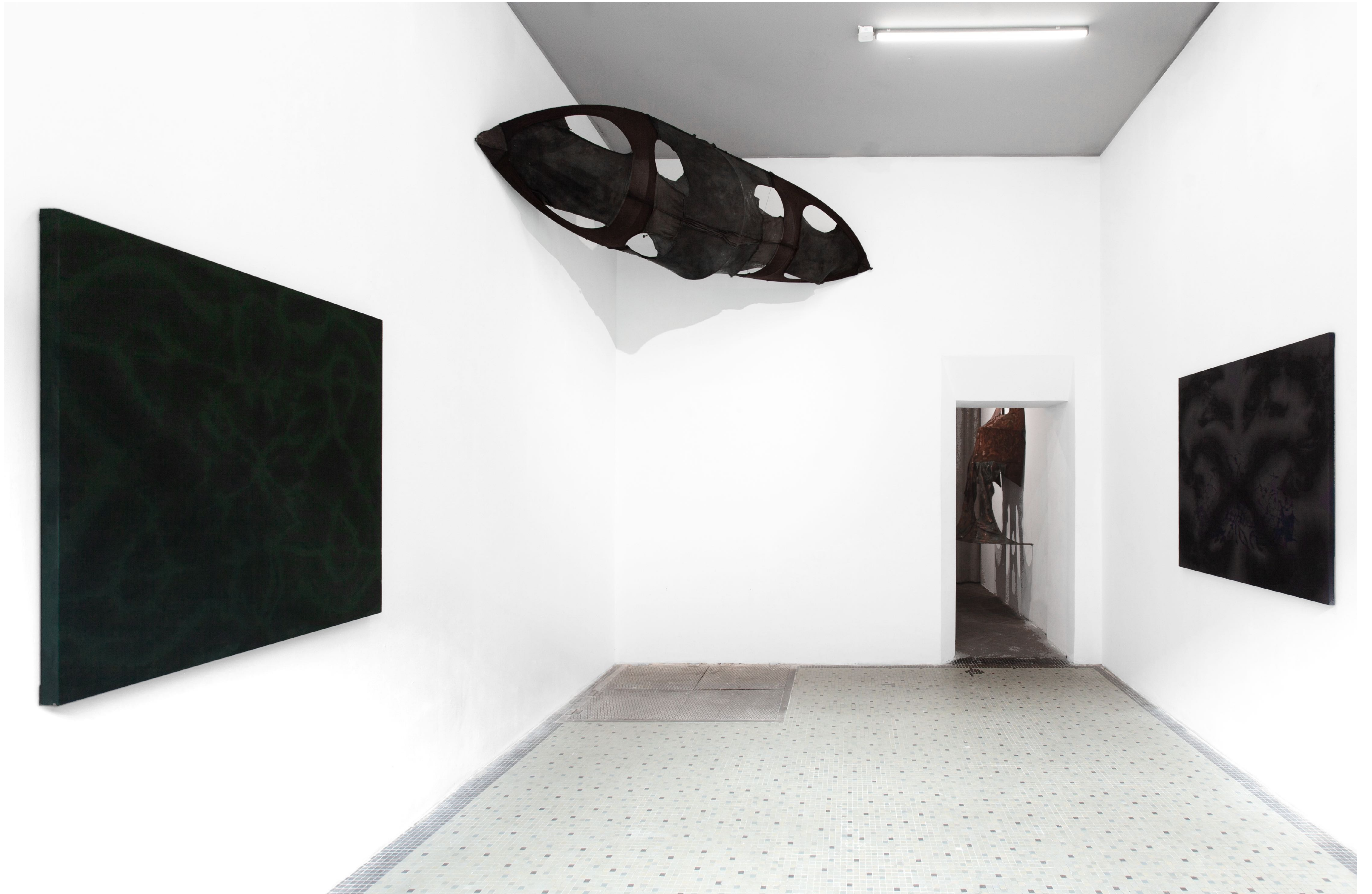
Studium rozpadu, studium rozkwitu | Marszałkowska 18, Warszawa