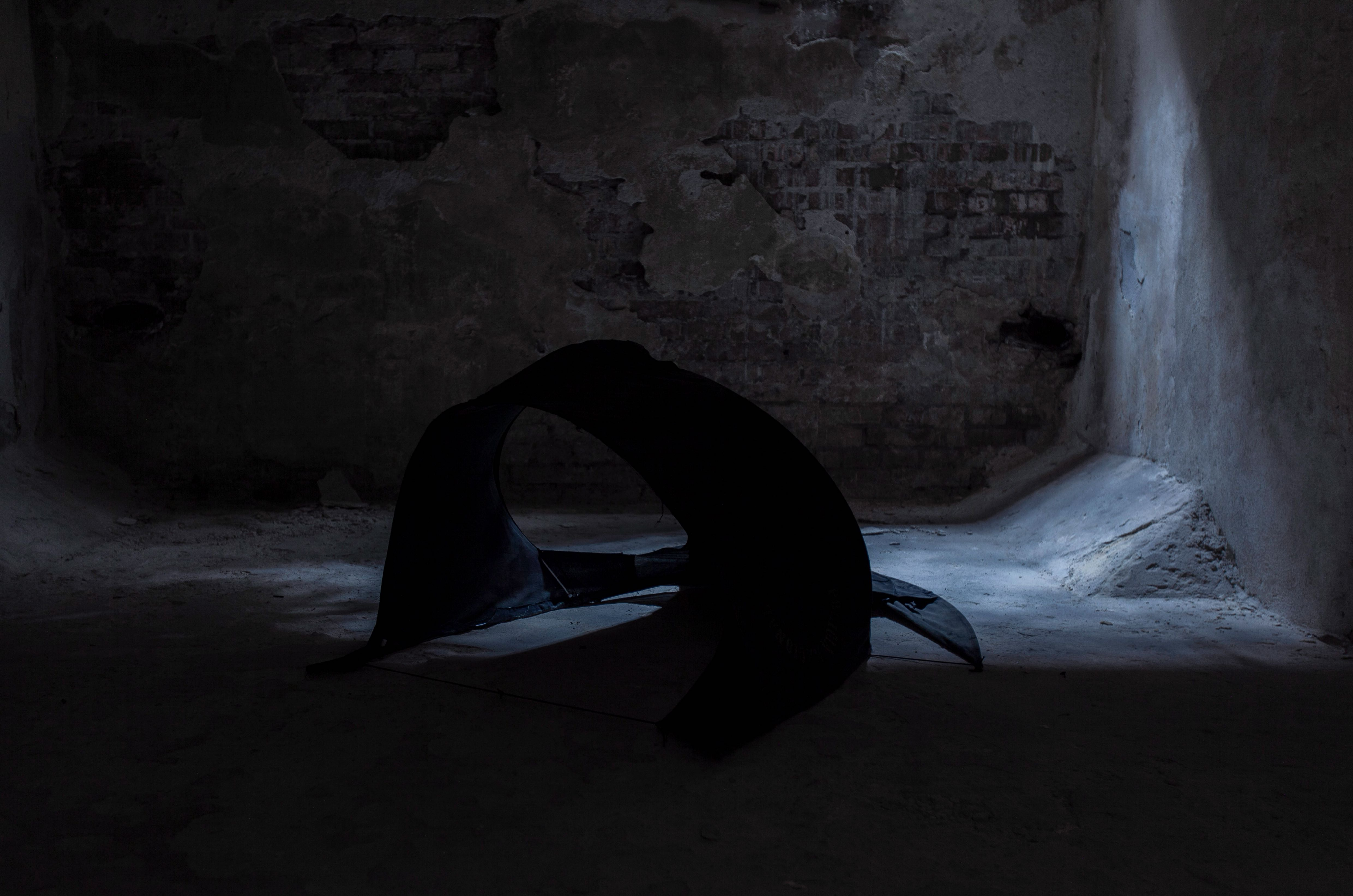
Studium rozpadu, studium rozkwitu | Marszałkowska 18, Warszawa